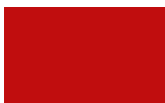
Feuerrot ca. RAL 3000 D