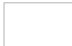
Reinweiß ca. RAL 9010 D SB VB