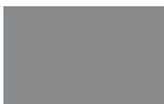
Staubgrau ca. RAL 7037 SB VB